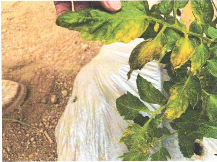
Figura 1 Identificación de enfermedad en tomate ( Solanum lycopersicum )