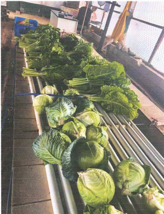
Figura 6 repollo y acelga se tiene que contar