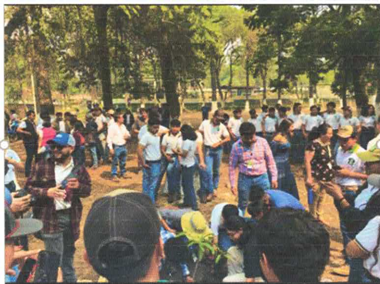
Figura 4 siembra de árbol Chico Zapote ( Manikara )