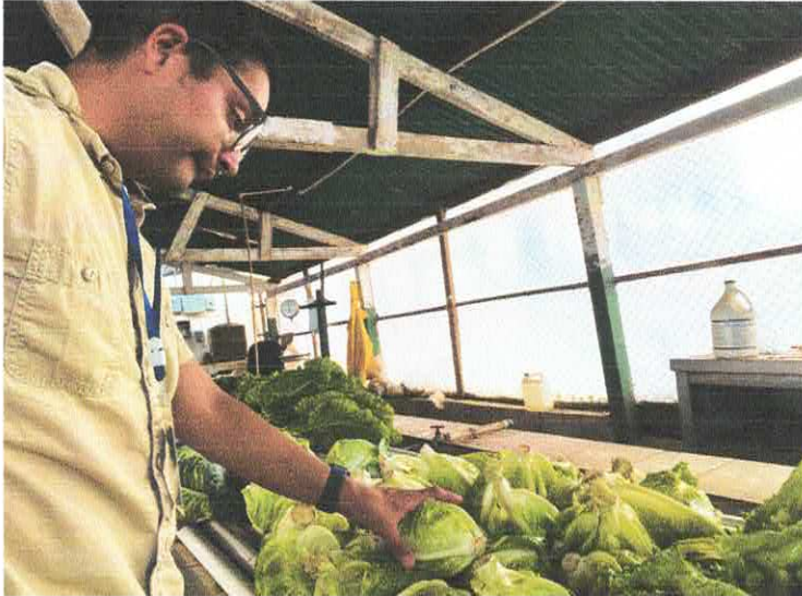
Figura 5 conteo de la cosecha de hortalizas