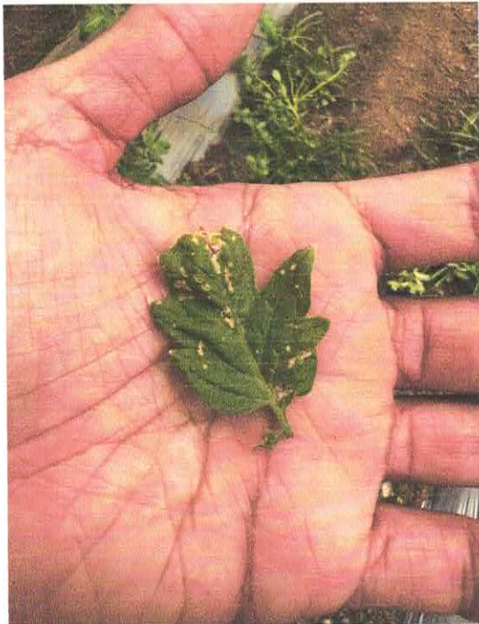
Figura 2 identificación de tizón tardío ( phytophthora infestans )