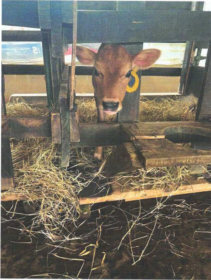
Figura 9 ternero en el potrero