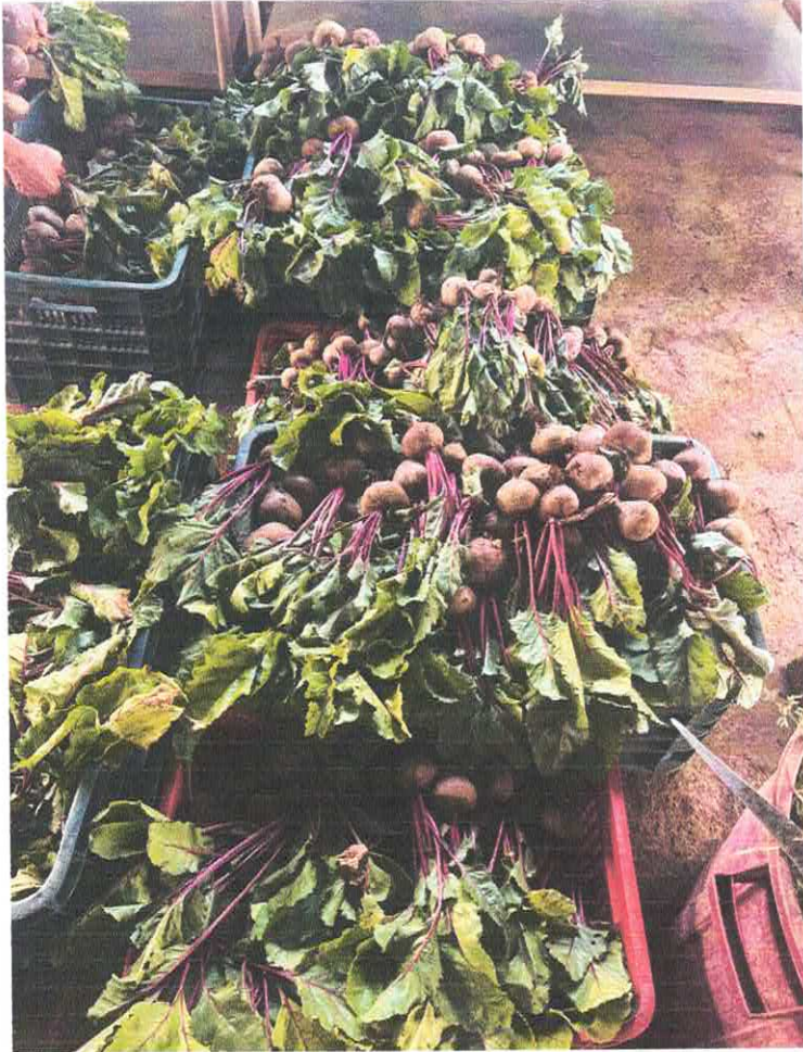
Figura 7 la cantidad de cosecha de la remolacha ( Beta vulgaris )