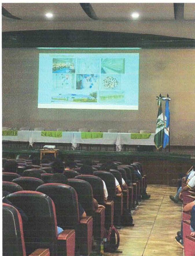
Figura 3 exposición Agrícola en la Escuela Nacional Central de Agricultura ENCA