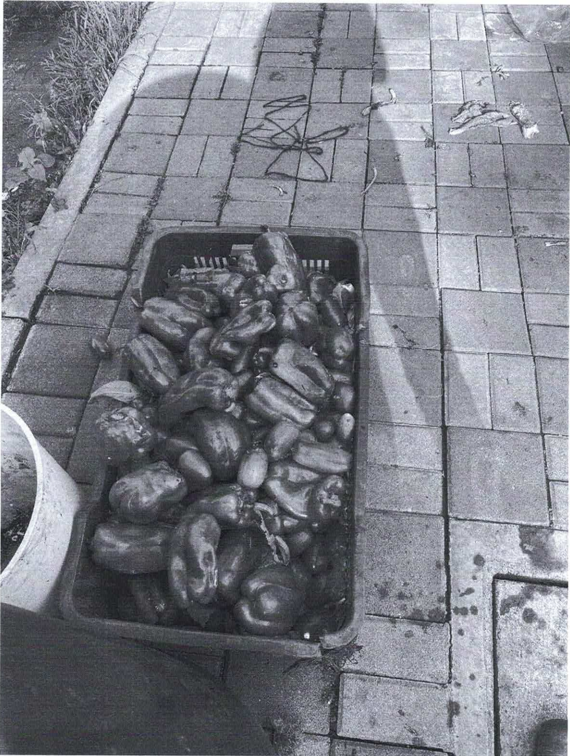
Figura N.O 5 desperdicio de hortalizas