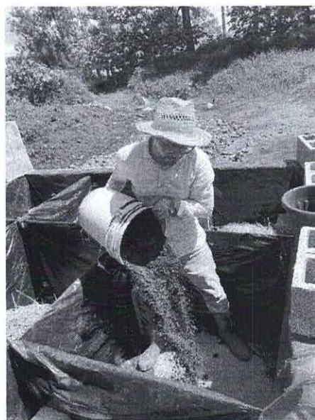
Figura N.O 2 haciendo las proporciones del compostaje