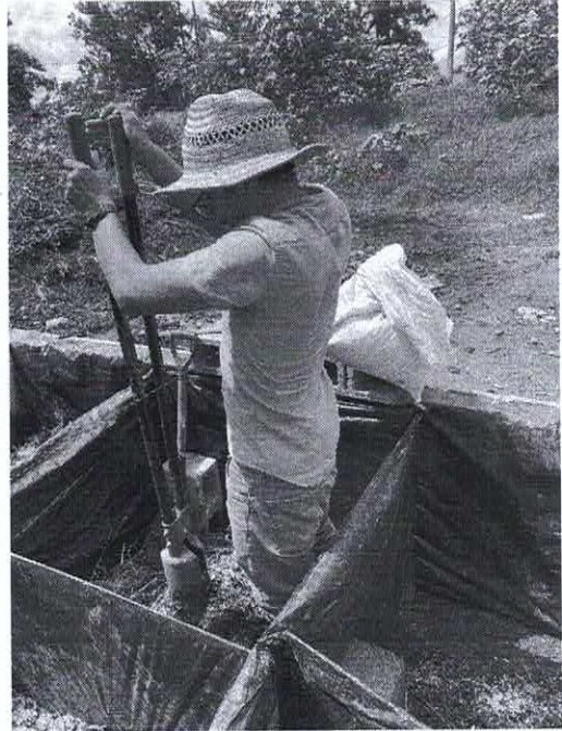
Figura N.O 4 manteniendo humedad