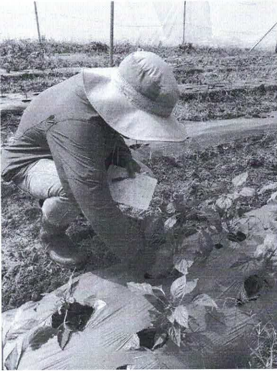
Figura N.O 3 Siembra de pilones