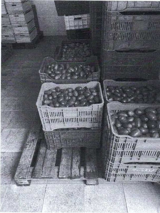
Figura N.O 6 cosecha de la produccion de tomate