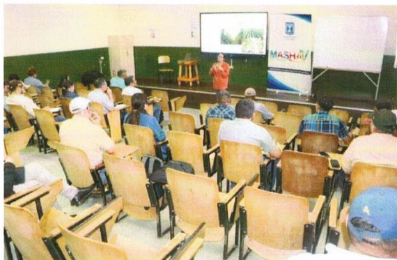
Figura 12. Charla con el Grupo de El Salvador

Al finalizar la capacitación, los participantes expresaron su satisfacción y entusiasmo por los conocimientos adquiridos, se logró transmitir de manera clara práctica la importancia de la innovación y la sostenibilidad en la agricultura, lo que dejó a los participantes motivados para implementar lo aprendido.