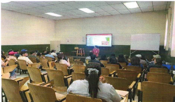
FIGURA 5. Charla a estudiantes

La capacitación resultó ser un éxito, brindando a los futuros agrónomos herramientas valiosas para su formación y sensibilizarlos sobre el impacto de las tecnologías agrícolas modernas. Este tipo de actividades refuerza el compromiso de la ENCA con la formación integral de sus estudiantes.