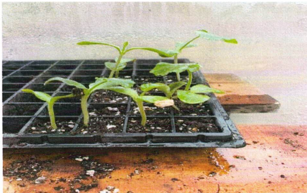
Figura 4. Plantas ya germinadas en su totalidad