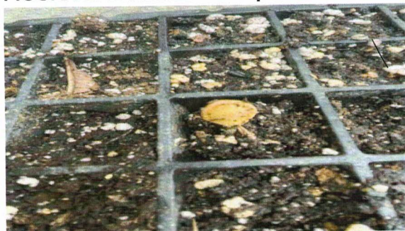
FIGURA 2. Germinación de primeras Plántulas de calabaza