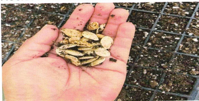
FIGURA 1. Germinación de semilla

Como resultado se obtuvo una tasa de germinación del 70% lo cual indica la viabilidad de las semillas y su calidad para el cultivo futuro, se fueron desarrollando con éxito, mostrando un crecimiento inicial saludable y uniforme.