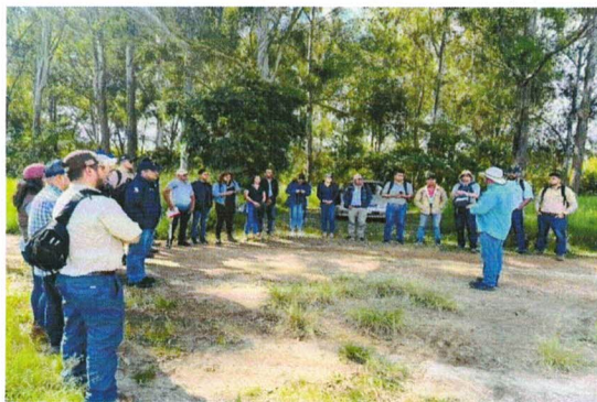
Figura 13. Charla en campo