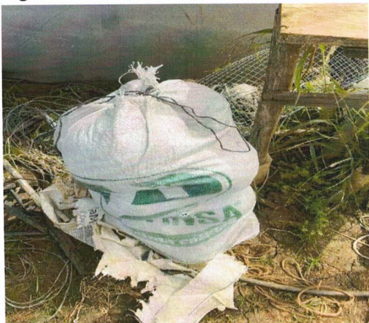
Figura 10. Cosecha de Calabaza ( Cucurbita maxima L)