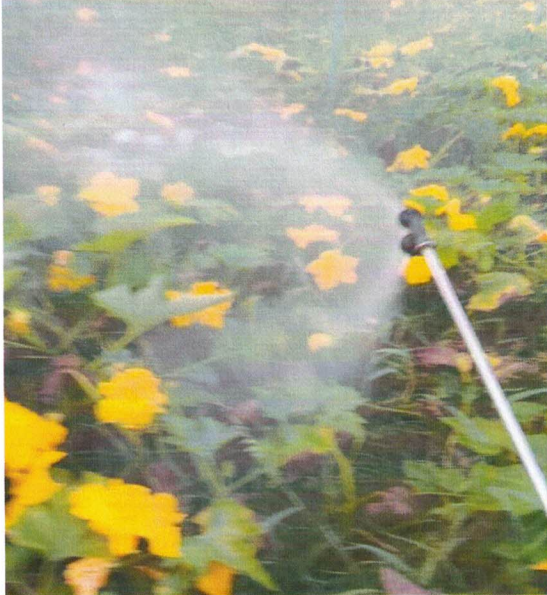
Figura 8. Control químico en calabaza