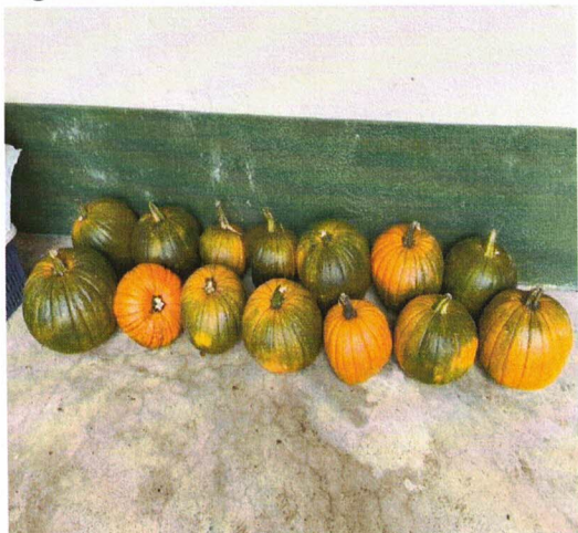
Figura 9. Cosecha del cultivo de calabaza ( cucurbita maxima L)