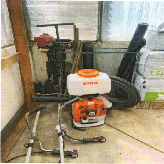
FIGURA 15. Inventario de Herramientas