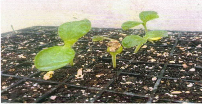
FIGURA 3. Éxito en la germinación de plántulas de calabaza