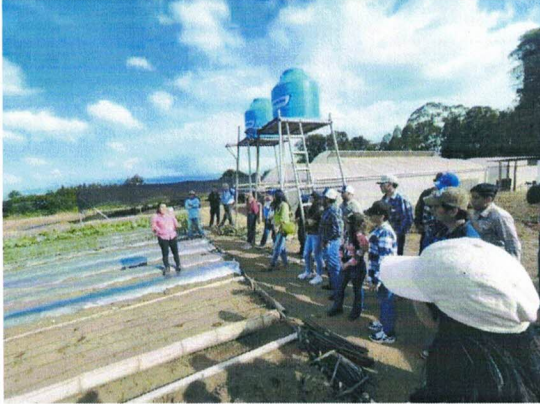
Figura 7. Charla sobre cultivo de calabaza