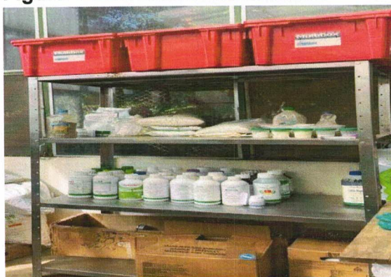
Figura 14. Inventario de Insumos