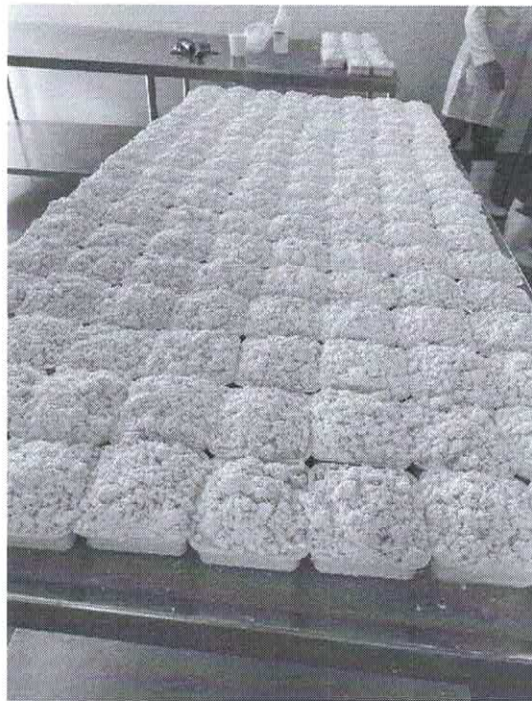
Ilustración 2. Empacado de queso de capas para acopio y cocina