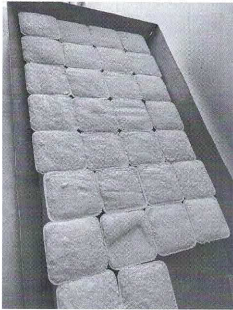
Ilustración 1. Empacado de queso fresco para acopio.