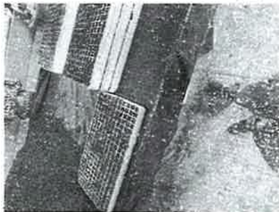
Apoyo en área de siembra