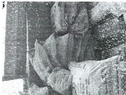
Inventario de fertilizantes