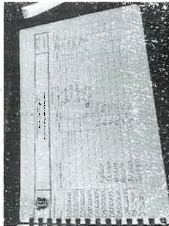
Registro de entradas y salidas de bodegas interna